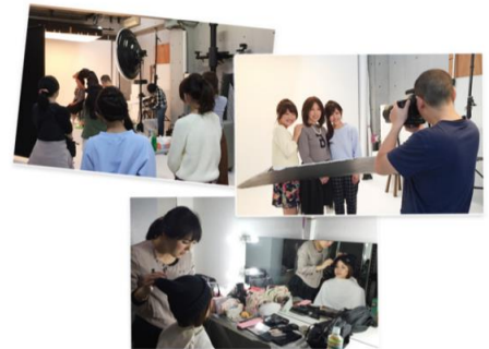
画像：過去の撮影会の様子