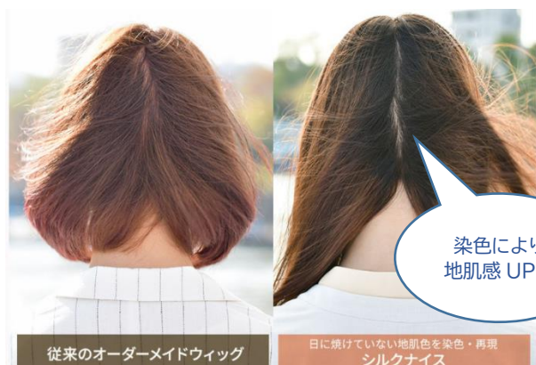
従来のオーダーメイドウィッグ

シルクの 抜群の通気性 で、汗や蒸れ感を解消！ 着用したまま入浴・シャンプー・ドライヤーもOK！ 髪の毛の根元は 地肌感にこだわり染色 した生地に職人が1本1本髪の特徴を計算した植毛を行ないます。 どこから風が吹いても安心の自然さを可能としました。