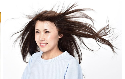
▲強風を当て、生え際の見え方を撮影