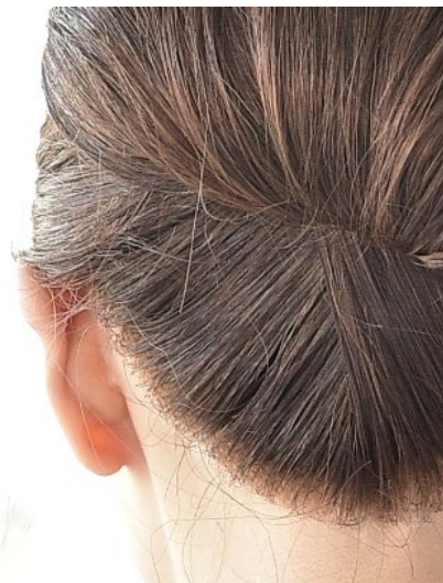
▲実際に当社のオーダーメイド医療用ウィッグを着けた写真