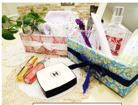
講座のイメージ画像

2015年8月に「女性活躍推進法」が国会で成立し、女性が活躍する社会となりました。