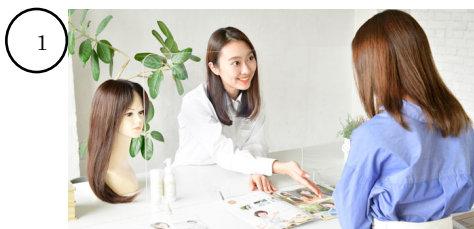
画像：カウンセリング

グローウィングの人工乳房は、胸部を3Dスキャナーにて測定。左右のバランスを見ながら作成します。その後、お客様に装着していただき肌の色と馴染むように着色を重ねていくオーダーメイドの人工乳房となります。肌の色を合わせるだけではなく、乳首の色形・血管やホクロまでも忠実に再現します。また接着剤を使用せず、肌に当てるだけで密着するFDA認証シリコンを使用をしています。完成した人工乳房は保湿性・抗菌性に優れた高機能和紙の専用ボックスでお渡しします。