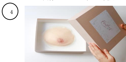
画像：完成した人工乳房